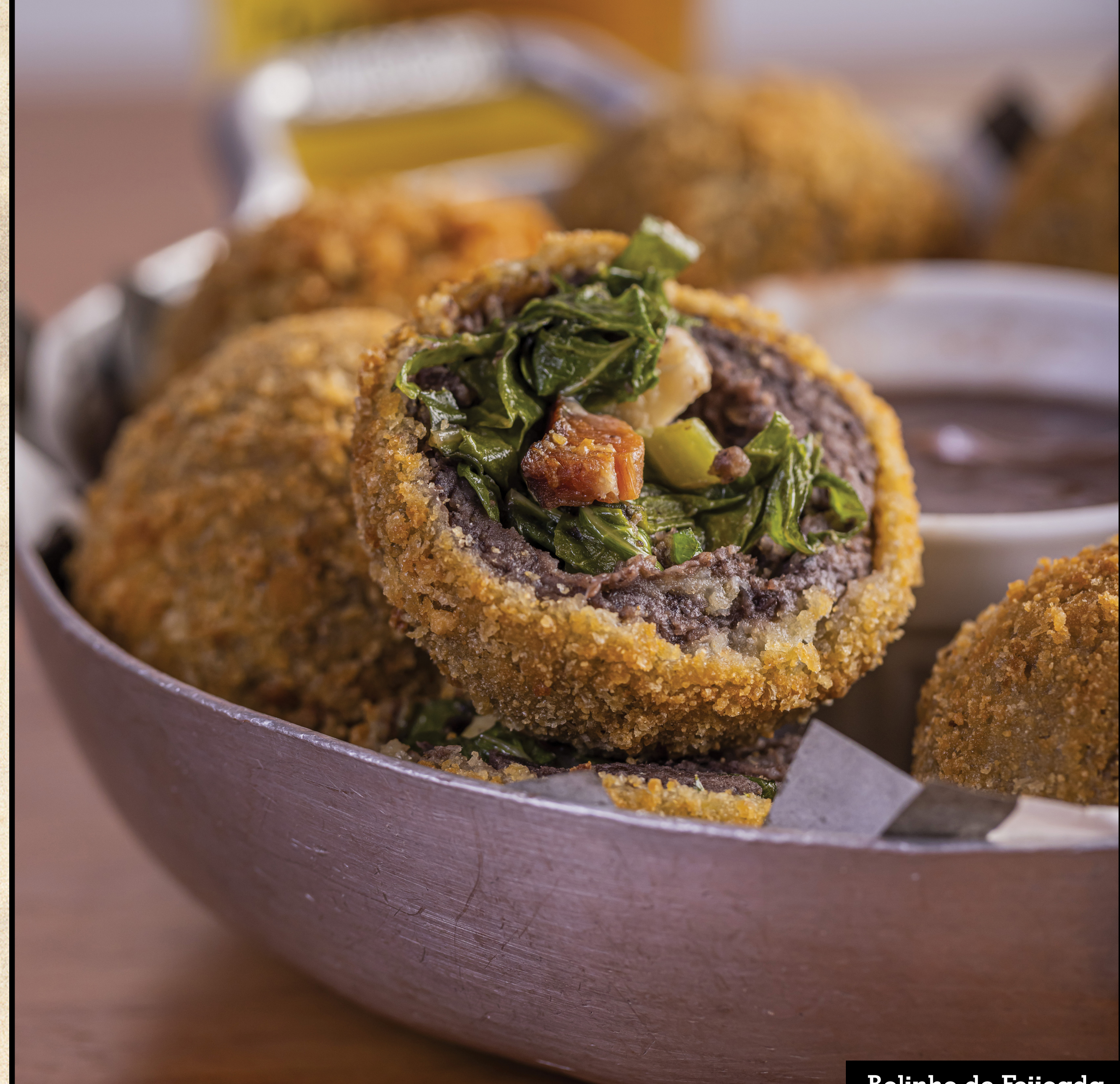
Bolinho de Feijoada

(carne ou frango) Filé empanado, molho de tomate e mussarela gratinada Parmigiana steak (meat or chicken), tomato souce and mozzarella au gratin