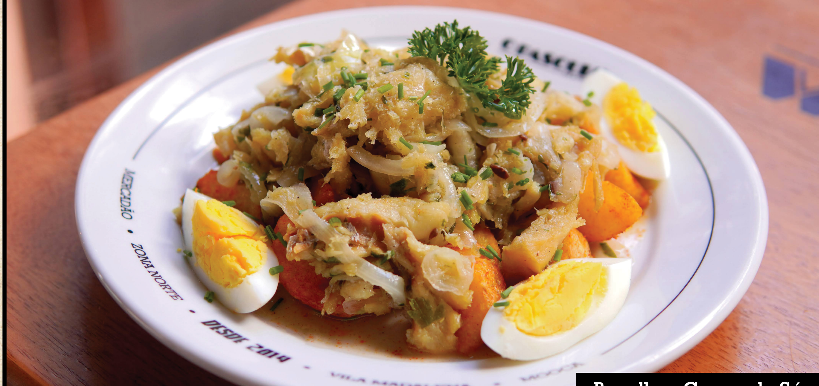
Bacalhau Gomes de Sá