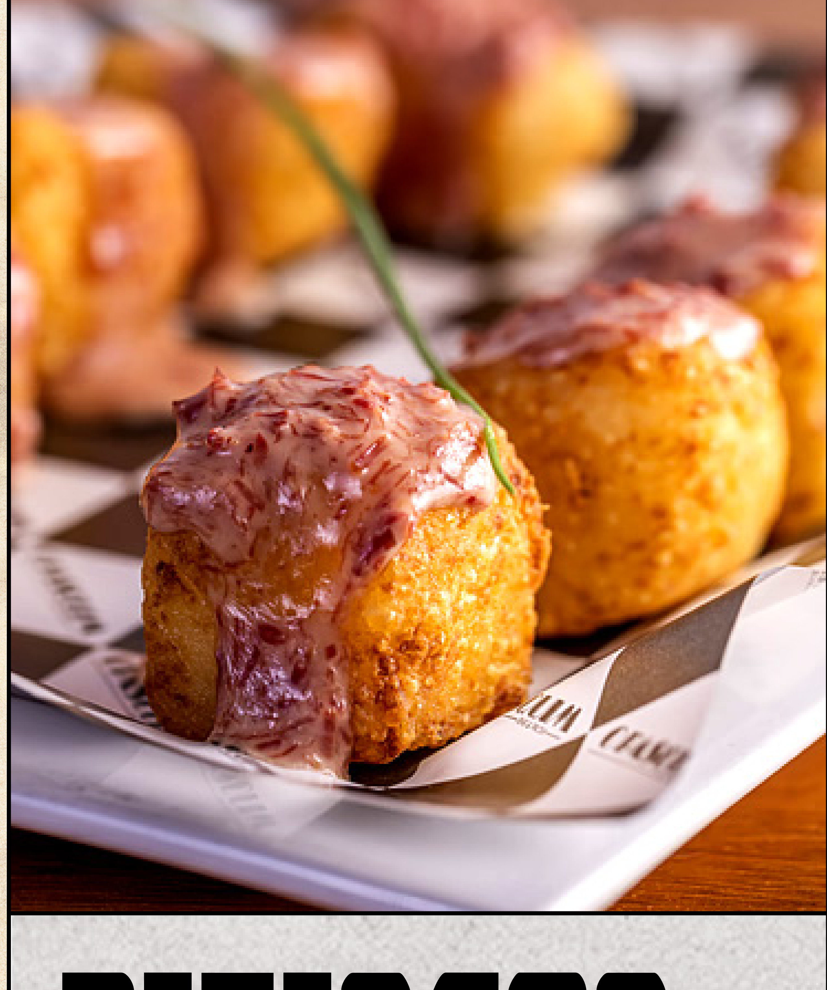
Dadinho de requeijão com carne seca

Dadinhos de tapica com queijo coalho e peperoni, assados ou fritos, cobertos com crispy de peperoni "Tapioca" dices with "coalho" cheese, baked or fried, topped with crispy peperoni