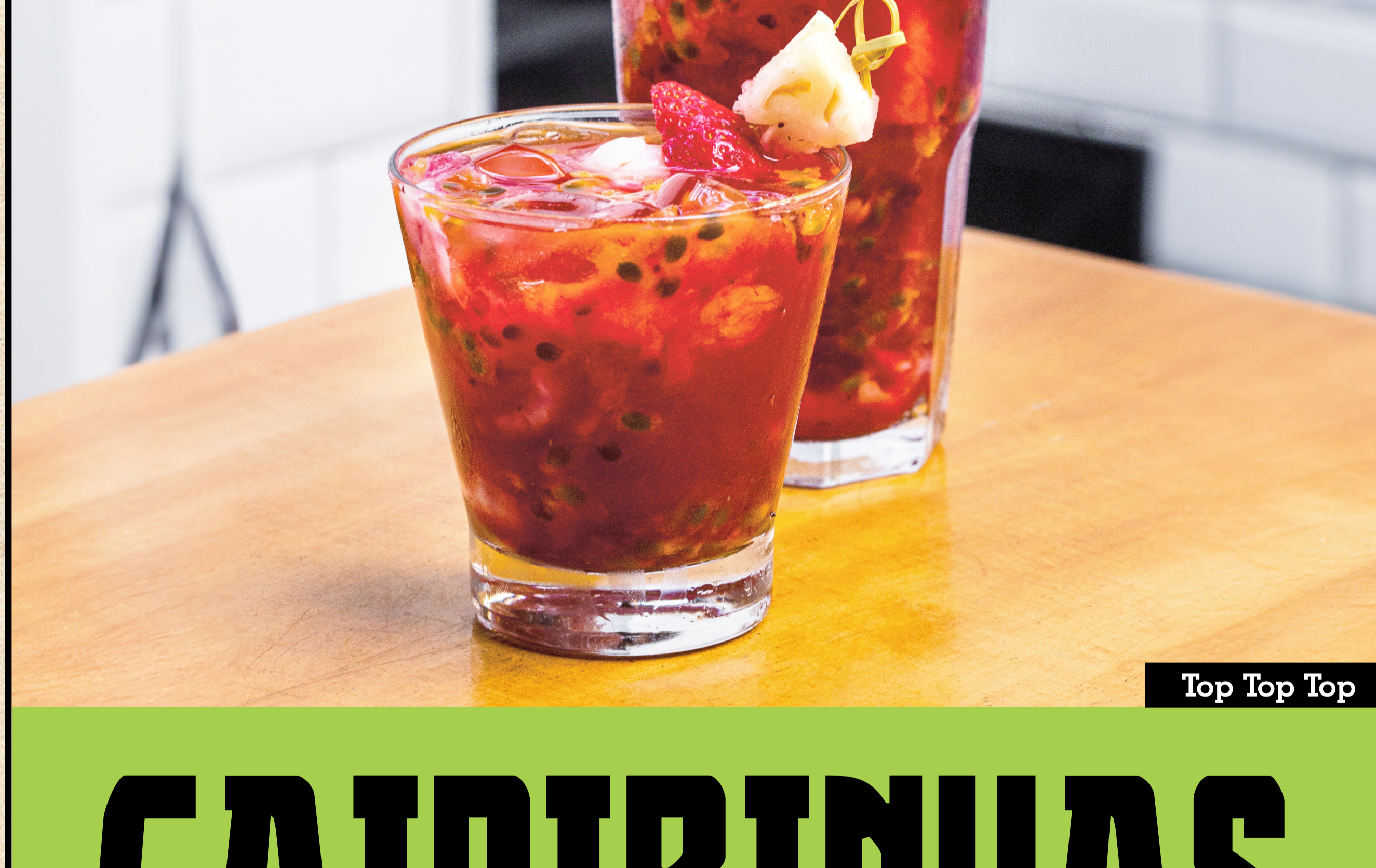
Top Top Top

A shot of Jose Cuervo Special Gold, 400ml of Amstel chopp, served with salted rim