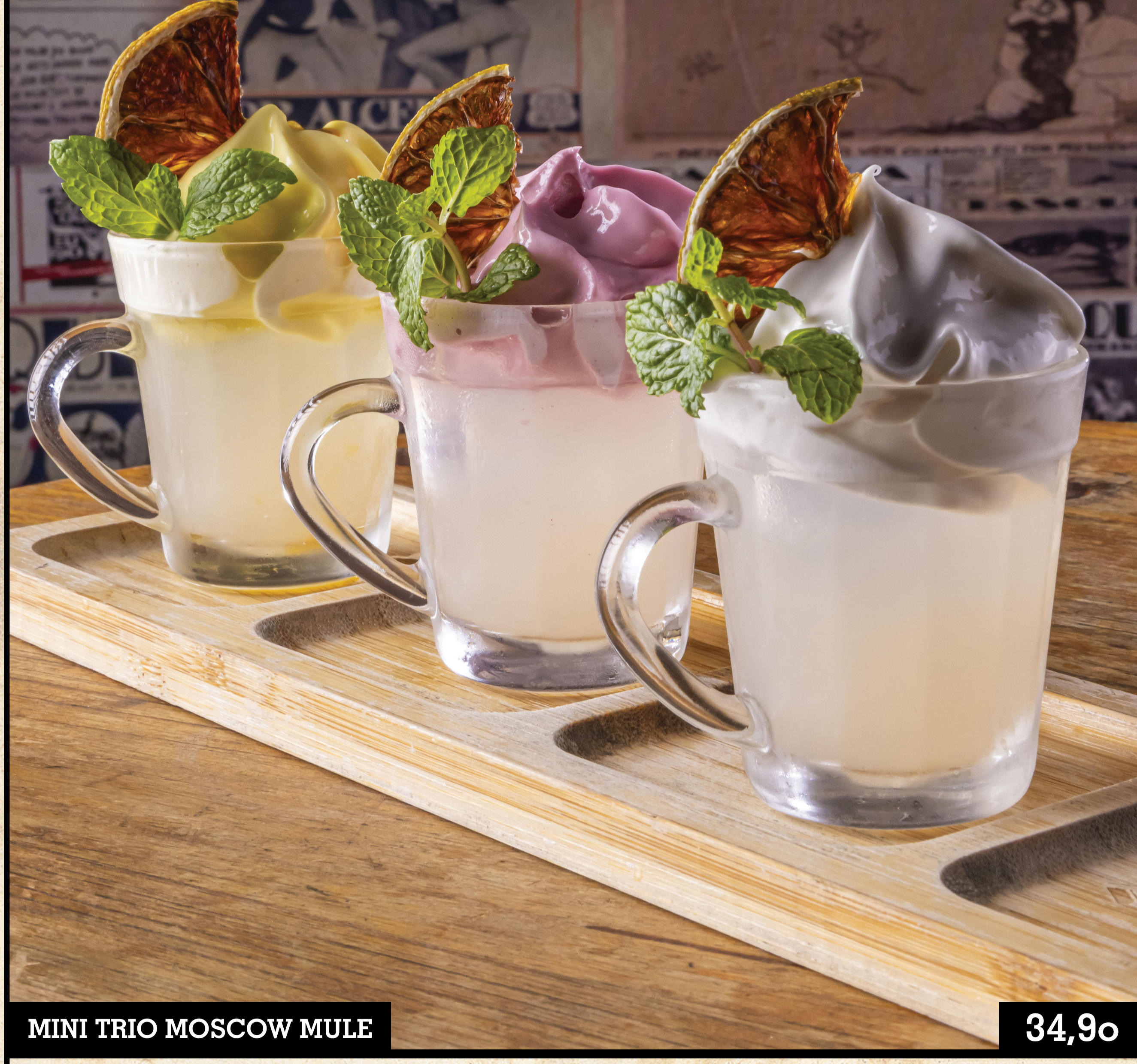
MINI TRIO MOSCOW MULE

3 Mini Moscow Mule, each one with a different foam for you to try: ginger, mango with passion fruit and wild berries fruits