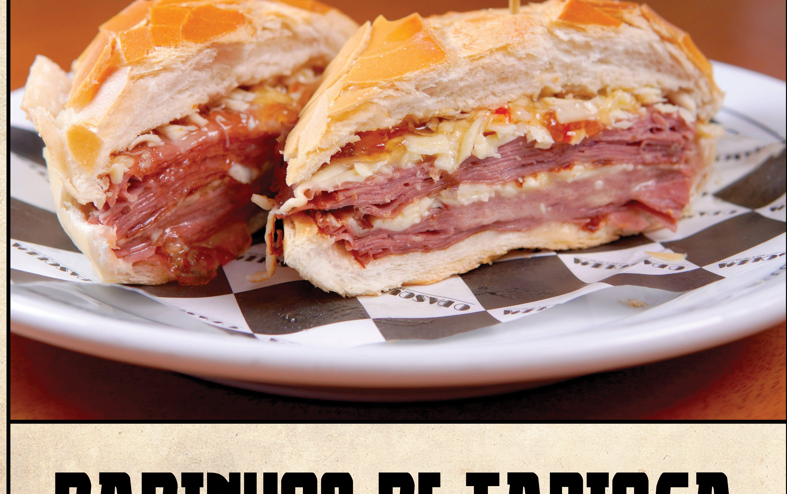
Mortadela O PASQUIM

Com mussarela derretida, alface, cebola caramelizada e tomate no pão de hambúrguer tradicional. Acompanha maionese verde e fritas Homemade burger with melted mozzarella, lettuce, caramelized onions and tomato. Served with green mayo and french fries