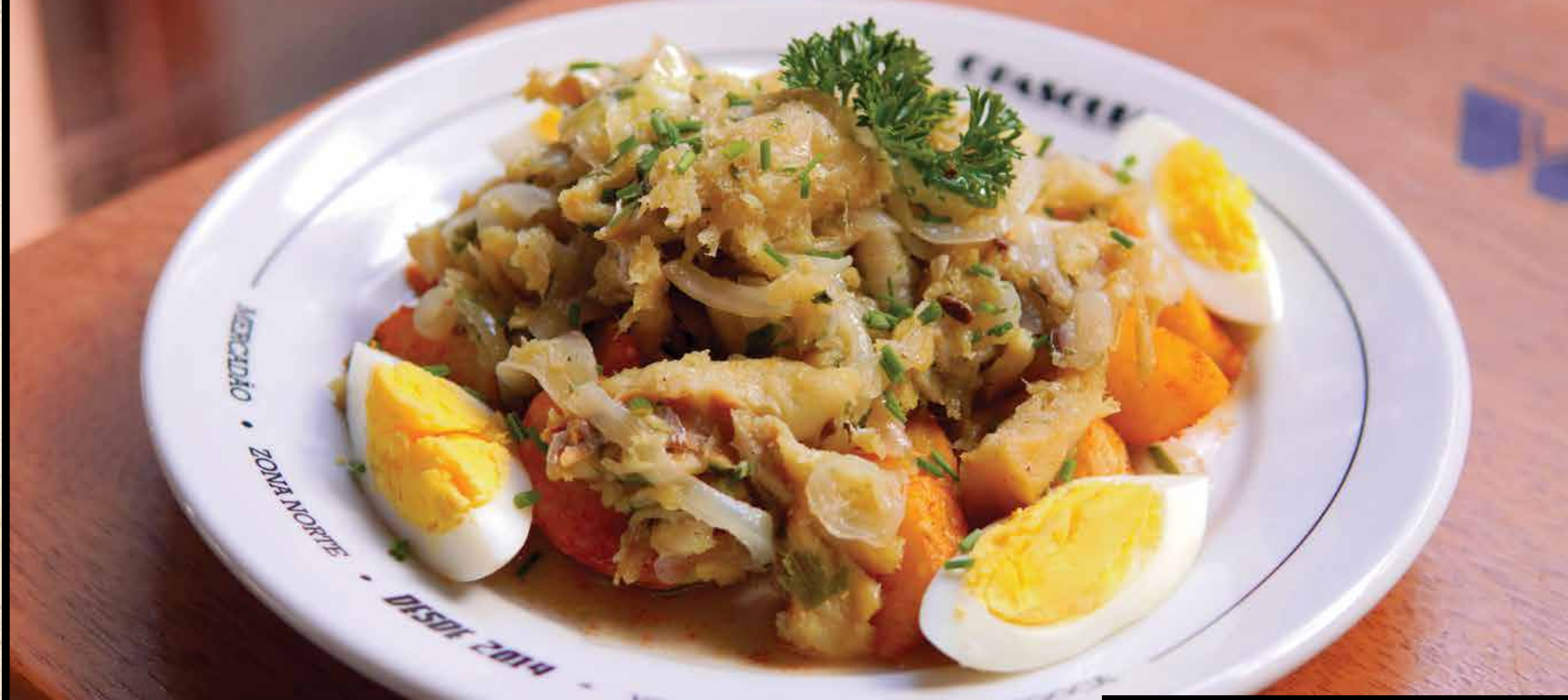
Bacalhau Gomes de Sá