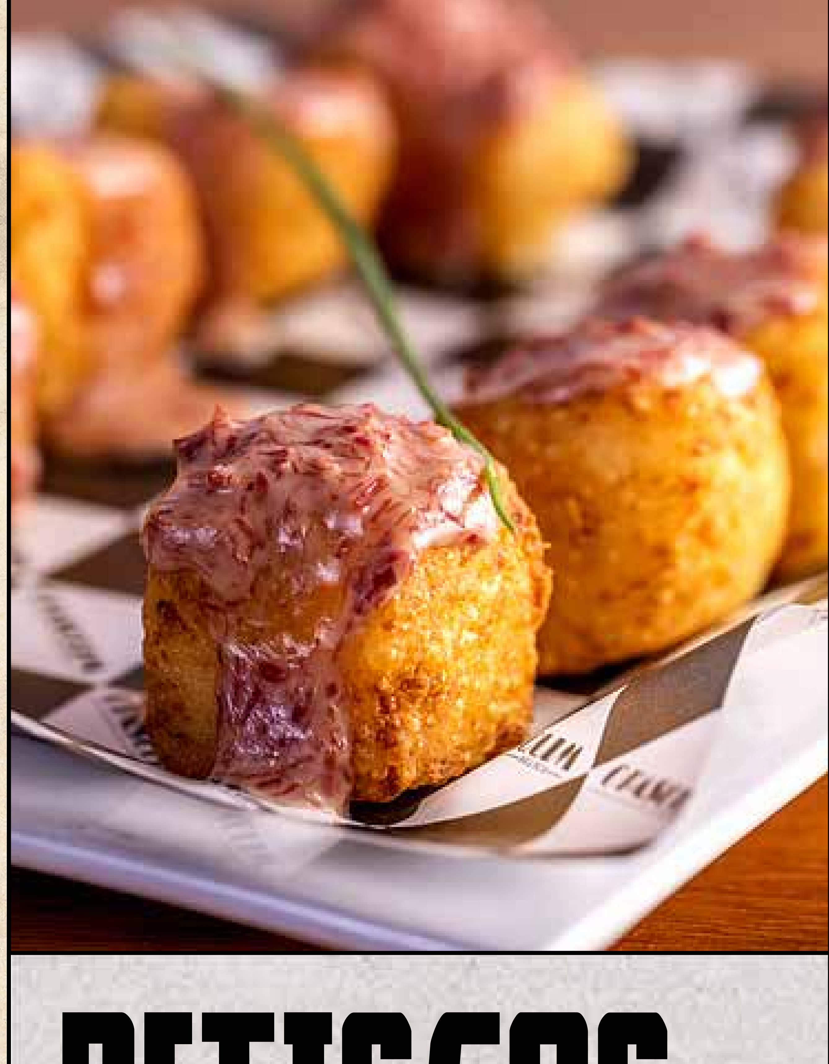
Dadinho de requeijão com carne seca

Dadinhos de tapioca com queijo coalho e peperoni, assados ou fritos, cobertos com crispy de peperoni "Tapioca" dices with "coalho" cheese, baked or fried, topped with crispy peperoni