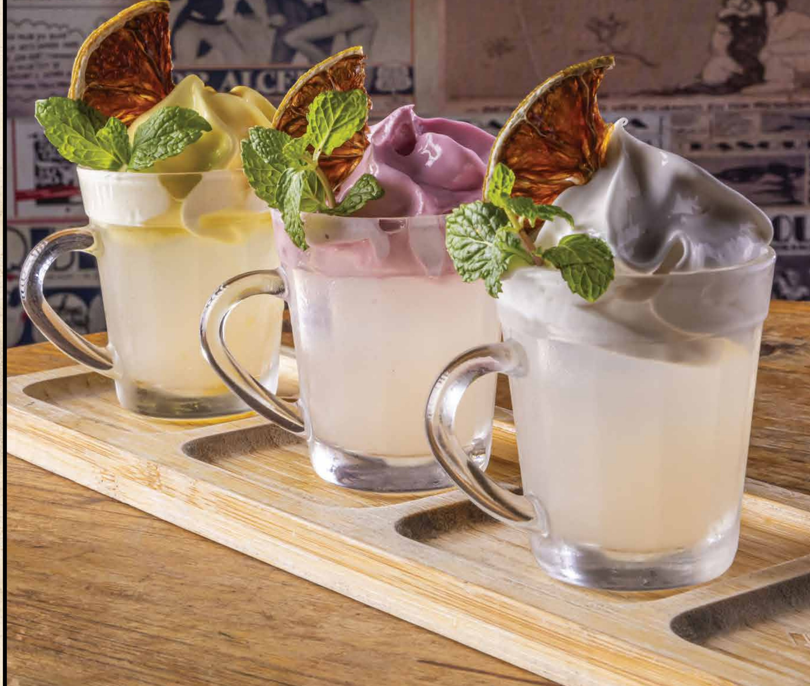
MINI TRIO MOSCOW MULE

3 Mini Moscow Mule, each one with a different foam for you to try: ginger, mango with passion fruit and wild berries fruits