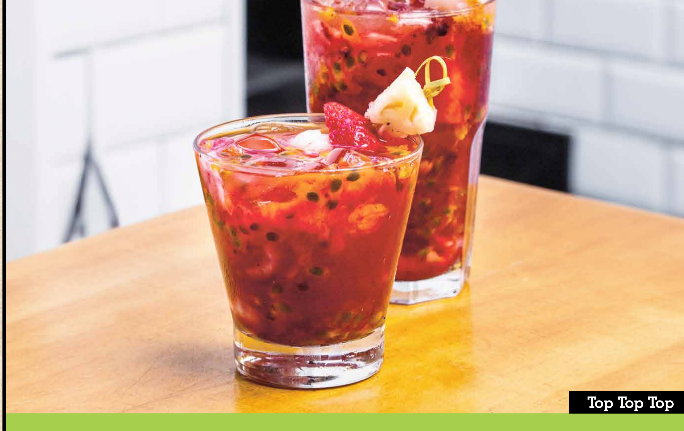
Top Top Top

A shot of Jose Cuervo Special Gold, 400ml of Amstel chopp, served with salted rim