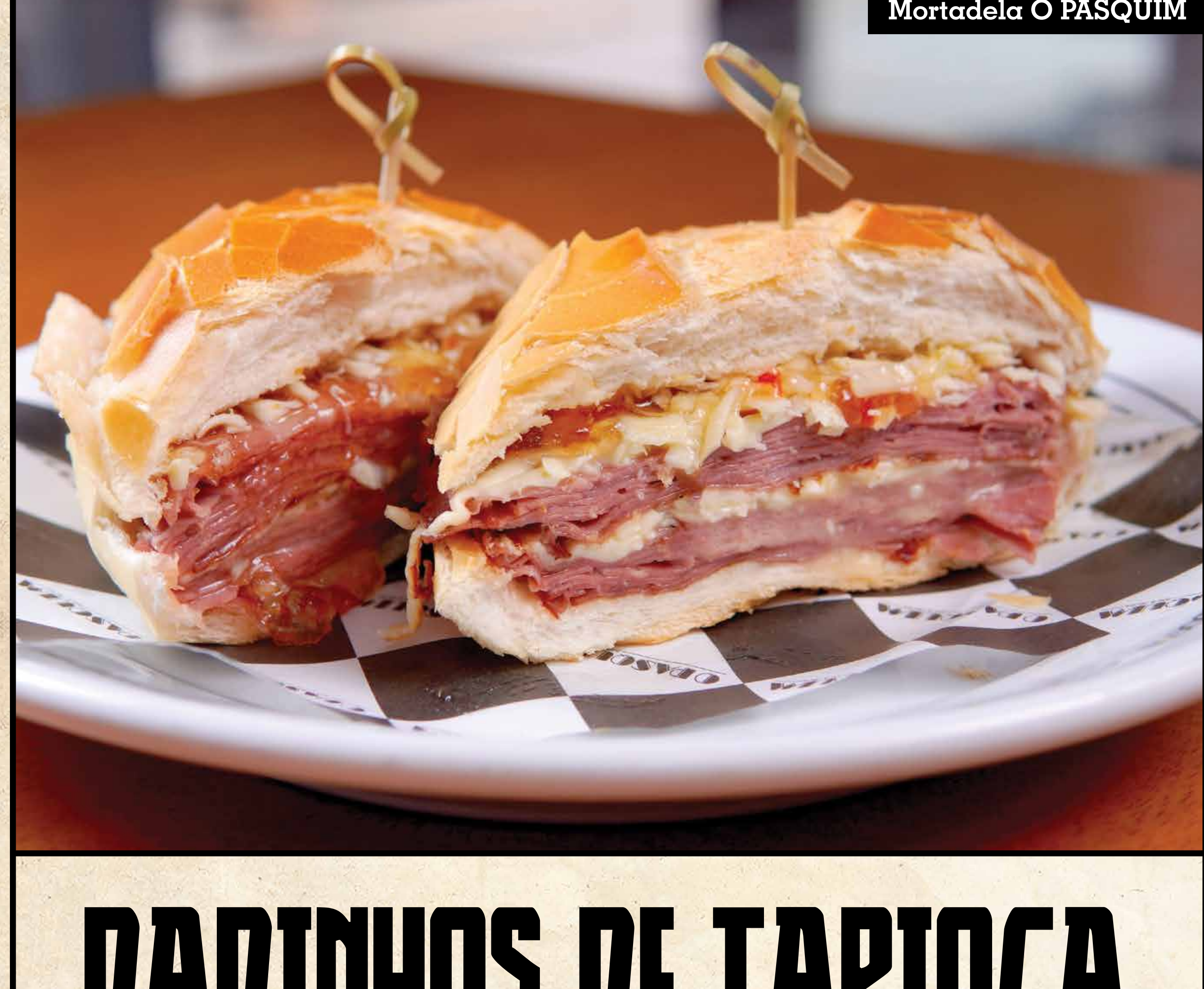
Mortadela O PASQUIM

Com mussarela derretida, alface, cebola caramelizada e tomate no pão de hambúrguer tradicional. Acompanha maionese verde e fritas Homemade burger with melted mozzarella, lettuce, caramelized onions and tomato. Served with green mayo and french fries