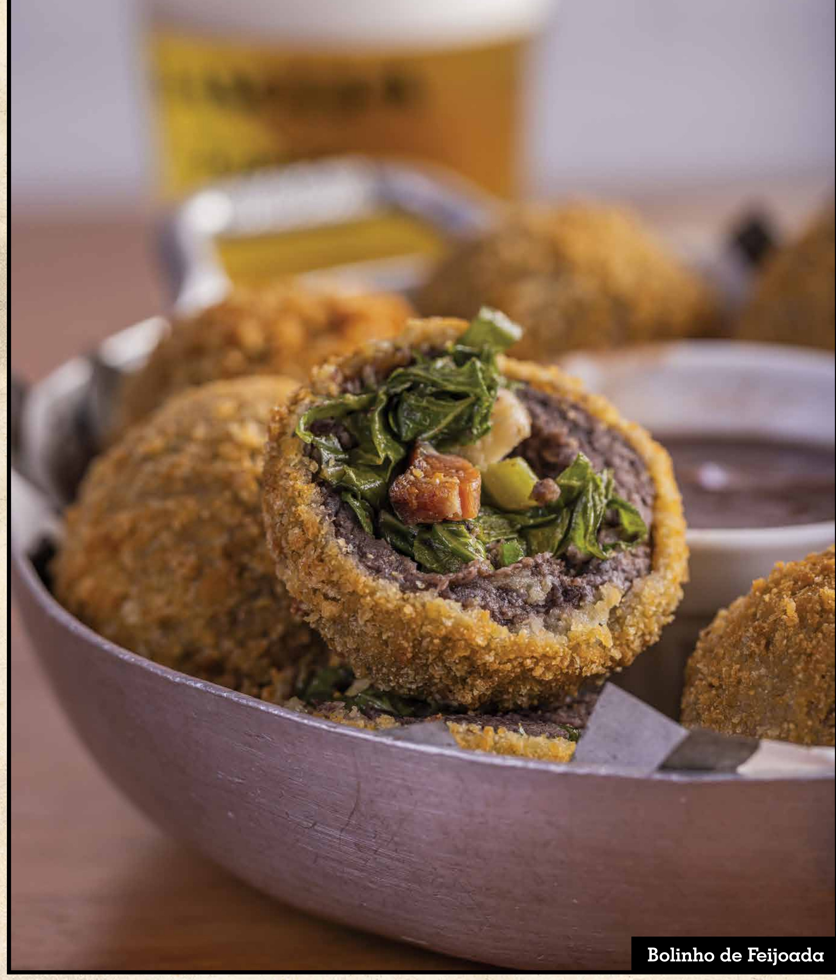
Bolinho de Feijoada

(carne ou frango) Filé empanado, molho de tomate e mussarela gratinada Parmigiana steak (meat or chicken), tomato souce and mozzarella au gratin